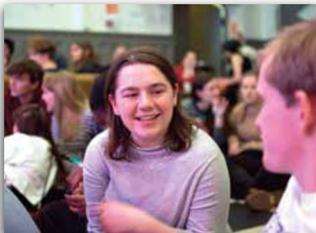
TGIF i Kulturkirken