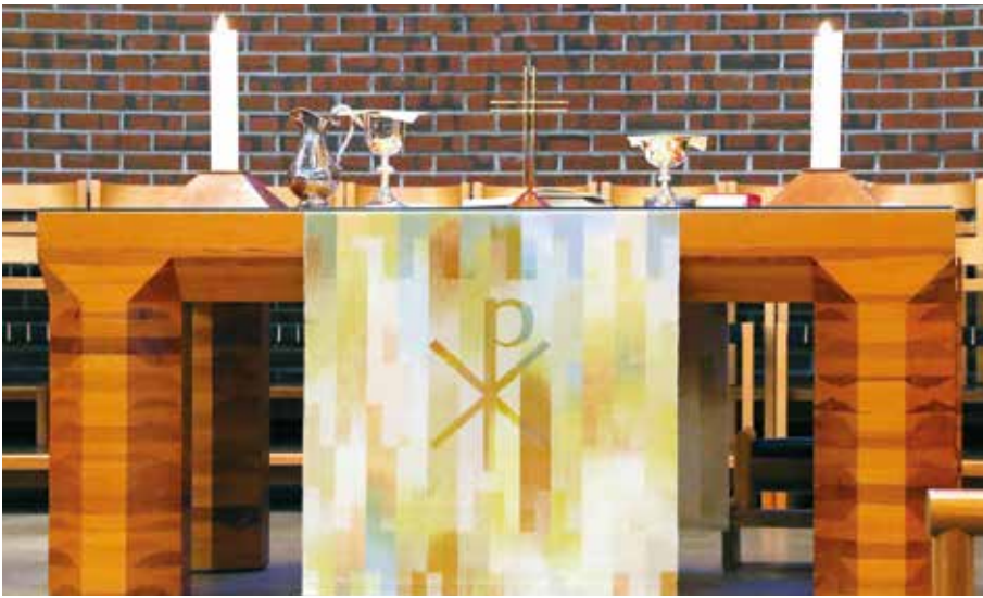
NYE ALTERDUKER: Åsane kirke har fått ny liturgiske tekstiler på alter, prekestol og lesepult.