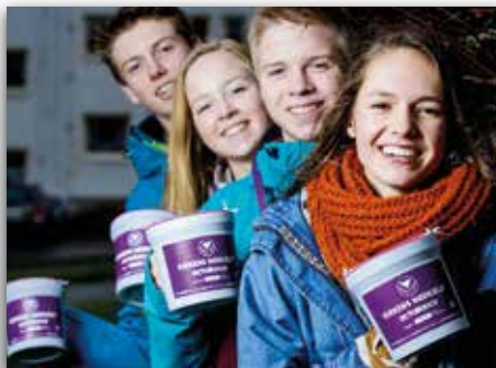
Ta vel imot bøsseberarane!